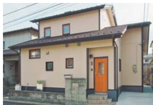
この家は外観だけでなく、性能も向上させた