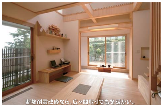
断熱耐震改修なら、広々間取りでも冬暖かい。